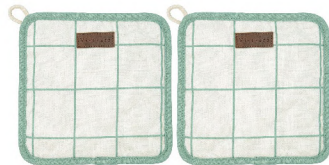
5427109 SET 2 AGARRADORES 20x20 CM 20% ALGODÓN - 80% POLIÉSTER RECICLADO