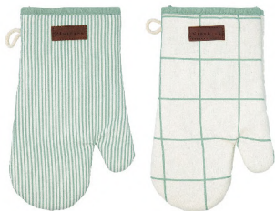
5427106 SET 2 MANOPLAS 18x28 CM EXTERIOR 20% ALGODÓN - 80% POLIÉSTER RECICLADO RELLENO 100% POLIÉSTER