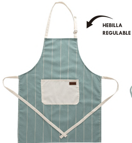
5427112 DELANTAL 60x75 CM 20% ALGODÓN - 80% POLIESTER RECICLADO