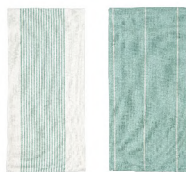
5427110 SET 2 PAÑOS COCINA 40x60 CM 20% ALGODÓN - 80% POLIESTER RECICLADO