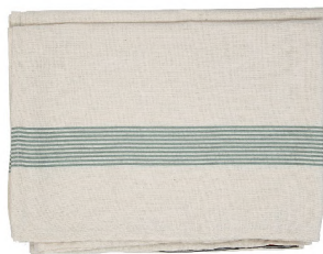
5427107 MANTEL ANTIMANCHAS 145x200 CM 20% ALGODÓN - 80% POLIESTER RECICLADO