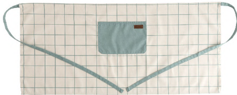
5427105 DELANTAL CORTO 50x110 CM 20% ALGODÓN - 80% POLIESTER RECICLADO