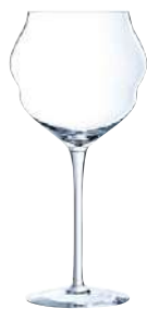
C6 COPAS 50 cl Ref: 9129412 Ref: AIF L9412 4/48 M: Ø 100 mm H: 215 mm P: 167 gr 47,80€