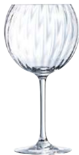
SYMETRIE C6 COPA GIN 58 cl Ref: 9428707 Ref: AIF Q8707 4/40 M: Ø 106 mm H: 209 mm P: 236 gr 26,90€

La colección Symetrie posee textura exterior con líneas simétricas que aportan a la cristalería, elegancia, diferenciación y tendencia.