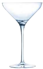
NEW MARTINI C6 COPAS COCKTAIL 21 cl Ref: 9123678 Ref: AIF L3678 4/32 M: Ø 114 mm H: 179 mm P: 168 gr 39,10€