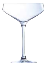
CABERNET C6 COPAS CHAMPÁN 30 cl Ref: 9306815 Ref: AIF N6815 2/40 M: Ø 120 mm H: 170 mm P: 175 gr 25,20€