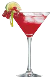
C6 COPAS COCKTAIL 21 cl Ref: 9306887 Ref: AIF N6887 2/40 M: Ø 116 mm H: 172 mm P: 215 gr 44,10€