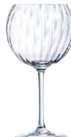
C6 COPA GIN 58 cl Ref: 9428707 Ref: AIF Q8707 4/40 M: Ø 106 mm H: 209 mm P: 235 gr 26,90€