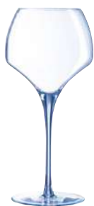
TANNIC C6 COPAS 55 cl Ref: 9261013 Ref: AIF U1013 4/40 M: Ø 107 mm H: 233 mm P: 207 gr 40,20€

Base del pie extraplana que favorece la estabilidad y evita la retención del agua en el lavavajillas.