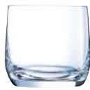
C6 VASOS BAJOS 37 cl Ref: 9122370 Ref: AIF L2370 4/120 M: Ø 93 mm H: 87 mm P: 376 gr 23,70€