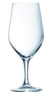
EVIDENCE C6 COPA 45 cl Ref: 9432821 Ref: AIF V2821 4/64 M: Ø 84 mm H: 209 mm P: 190 gr 20,20€