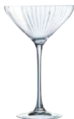
C6 COPA COCKTAIL 21 cl Ref: 9431171 Ref: AIF V1171 4/32 M: Ø 114 mm H: 179 mm P: 168 gr 34,20€