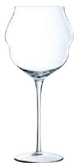
MACARON C6 COPAS 60 cl Ref: 9129414 Ref: AIF L9414 2/40 M: Ø 105 mm H: 235 mm P: 195 gr 48,80€