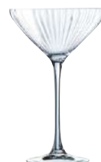
C6 COPA COCKTAIL 21 cl Ref: 9431171 Ref: AIF V1171 4/32 M: Ø 114 mm H: 179 mm P: 168 gr 34,20€