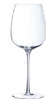
VILLENEUVE C12 COPAS 73 cl Ref: 5424606 Ref: AIF Q5375 1/18 M: Ø 101 mm H: 258 mm P: 229 gr 97,00€

La colección Villeneuve ha sido desarrollada pensando en la alta gastronomía. Por la forma de su cáliz, pie estilizado y base ancha, Chef & Sommelier vuelve a reinventar el servicio del vino con copas versátiles que se adaptan a la perfección al maridaje de restaurantes gastronómicos y de aquellos que buscan un servicio de vino único y basado en la excelencia.