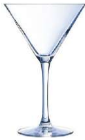
CABERNET C6 COPAS COCKTAIL 30 cl Ref: 9306831 Ref: AIF N6831 2/32 M: Ø 120 mm H: 188 mm P: 220 gr 47,90€