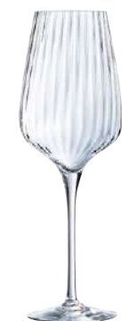
SYMETRIE C6 COPA 55 cl Ref: 9432696 Ref: AIF V2696 2/48 M: Ø 92 mm H: 260 mm P: 215 gr 26,90€